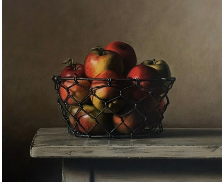
"Appels in draadmandje"