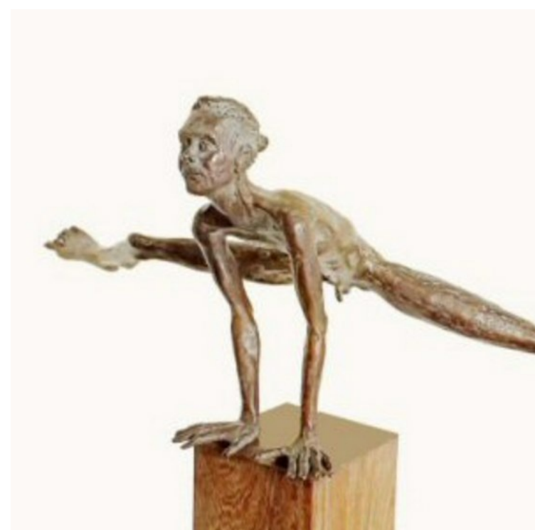
"No guts, no glory"